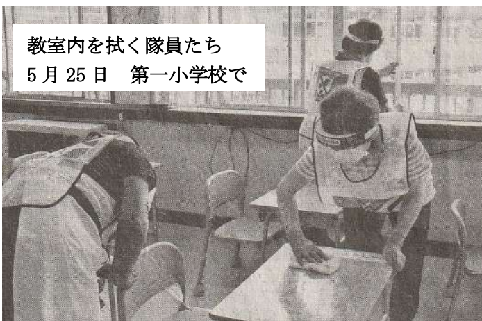
教室内を拭く隊員たち 5月25日 第一小学校で