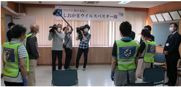
5月25日 しおがまウイルスバスター隊出動式 6月1日の学校再開に先駆けて除染作業開始した