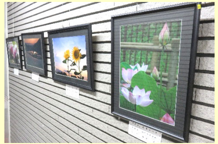
【写真同好会の展示写真（当センター1階）】

【 つぶやき 】 「 暦注 」 最近パソコンやスマートホーンでネタ探しをしていると聞いたことがあるが、なんとなくしか分からない言葉に多く出くわします。その中の一つが暦に関わることです。