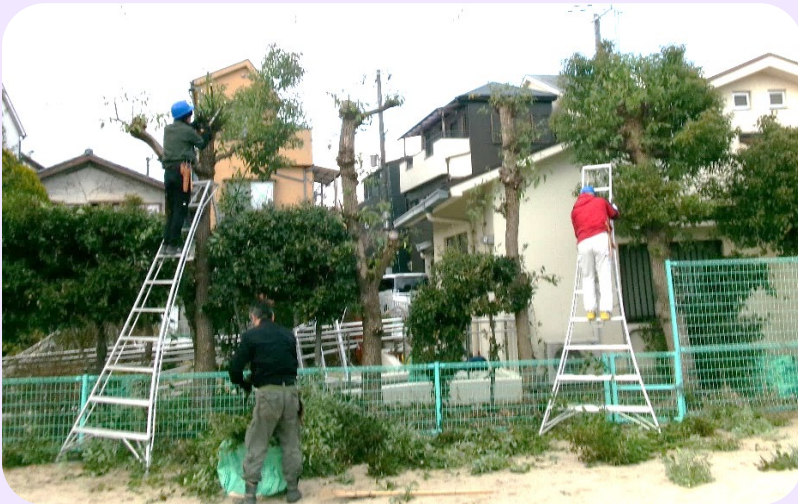
【 令和6年2月6～7日実施 受講者2名 】