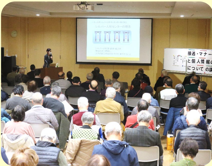
【 令和6年2月14日実施 受講者94名 】