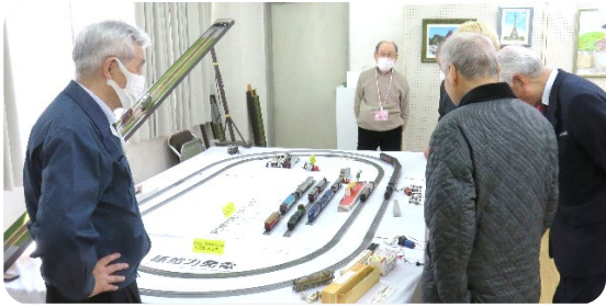
鉄道模型の展示は5年ぶりに実施されました！