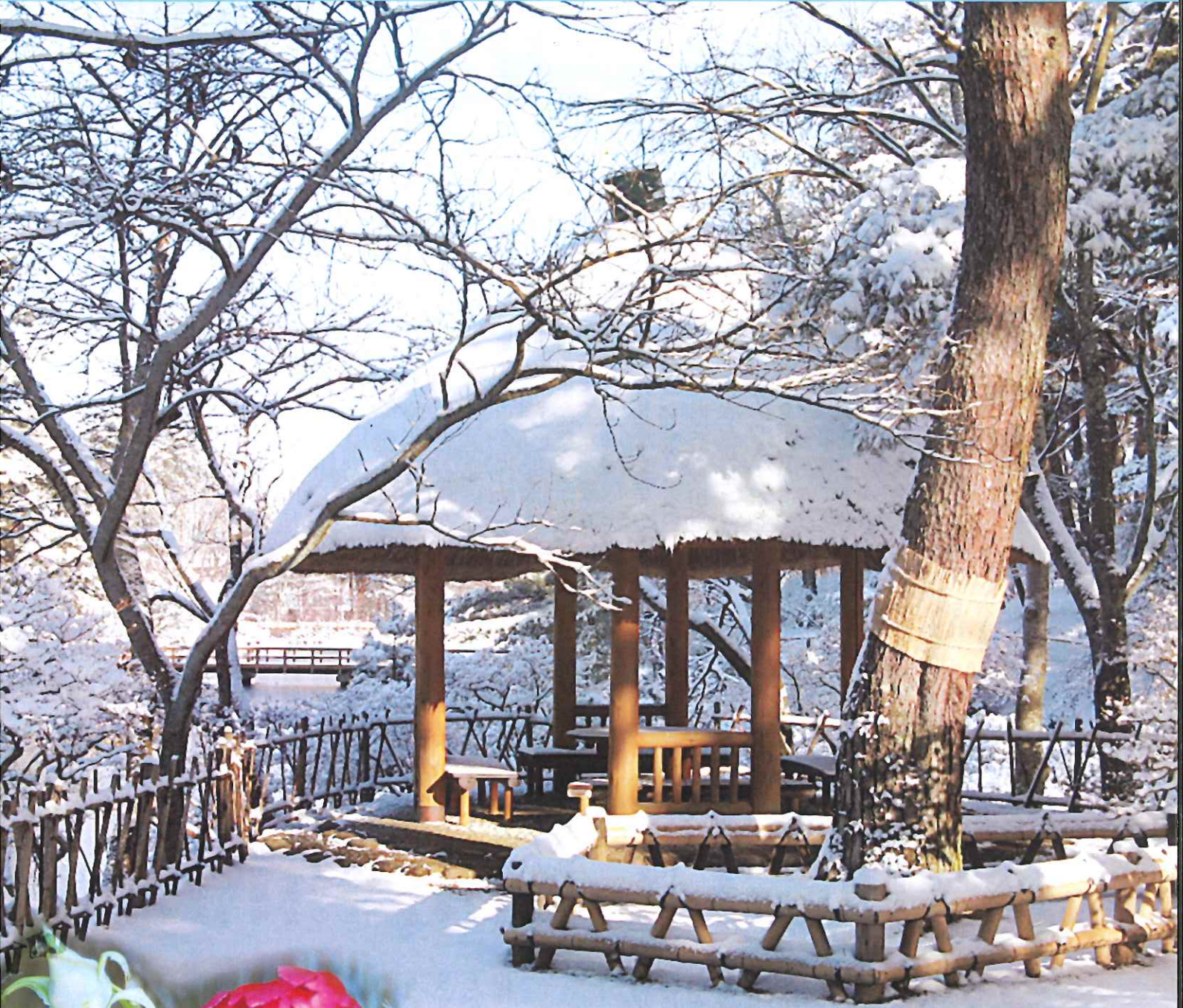
須賀川牡丹園の雪景色