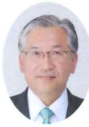
須賀川市長 橋本克也