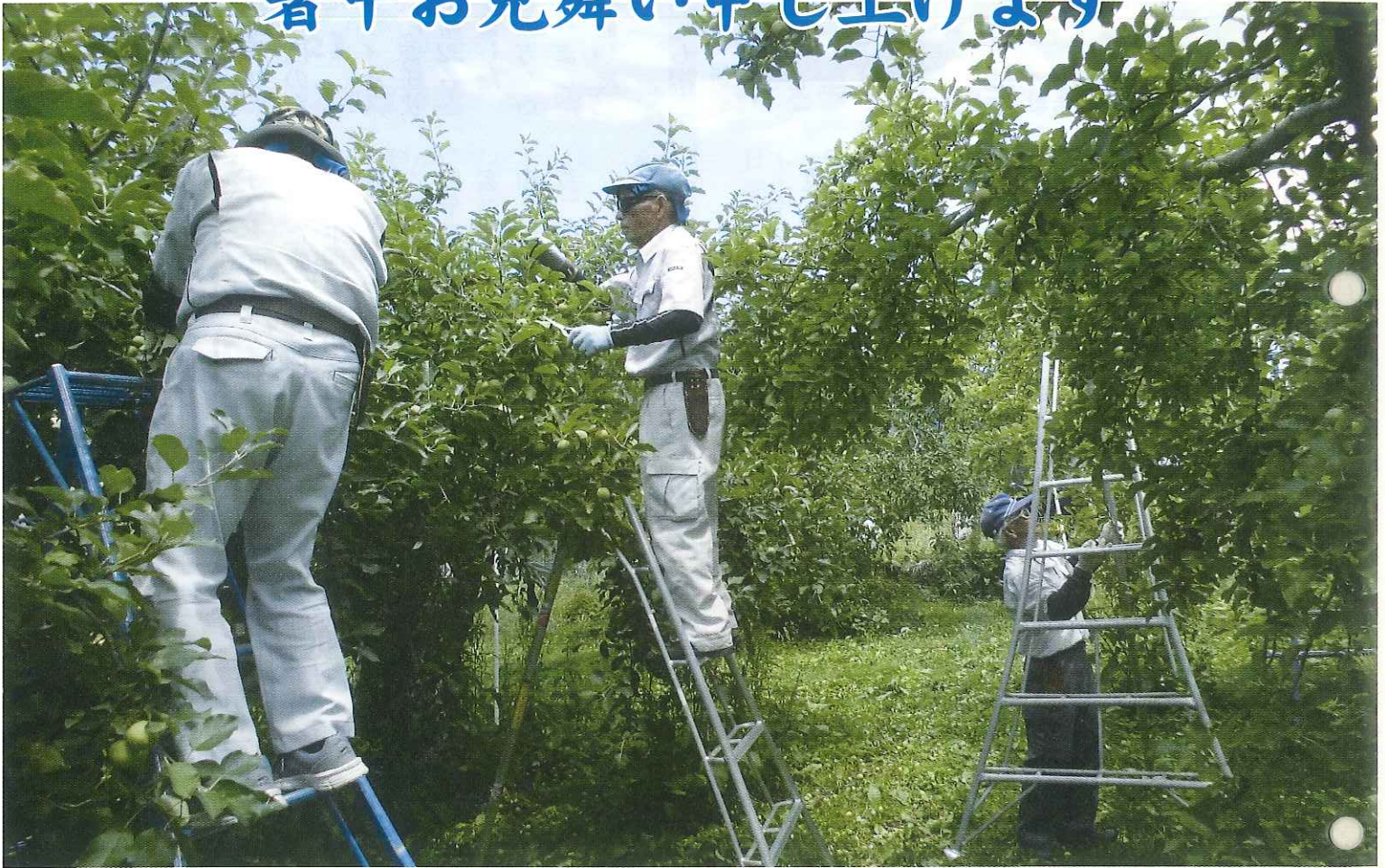
りんごの摘果作業