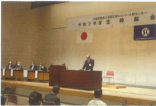
定時総会 (令和2年5月29日)