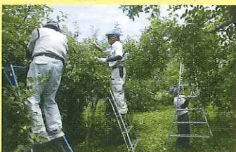
りんごの摘果作業

農作業の忙しい時期には依頼がたくさん！会員はそれぞれの技術で農家さんを支えています。