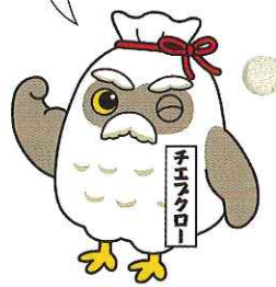
シルバー人材センター (愛称「生き生きセンター」)