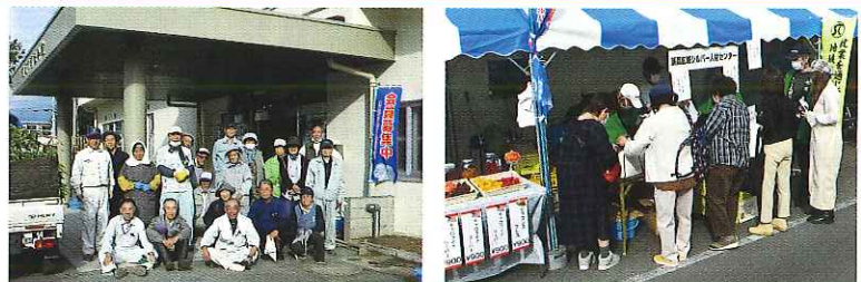
公共施設等の環境美化活動、六斎市、園児や親子らとの野菜植付収穫交流会、うまいもん市