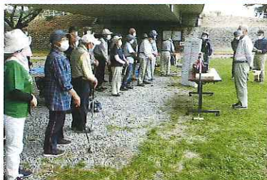
マレットゴルフ大会、親睦旅行、交流研修会、ふれあい広場参加