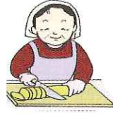
皿洗い・給食作業・賄・配膳