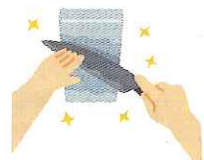
刃物とぎ(包丁・かま・なた)