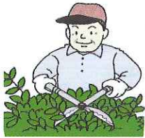
植木剪定・消毒 障子・襖の貼り替え