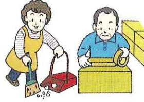
屋内外の簡単な作業