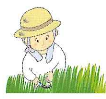
草取り・草刈り・農作業