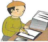
宛名書き・賞状書き