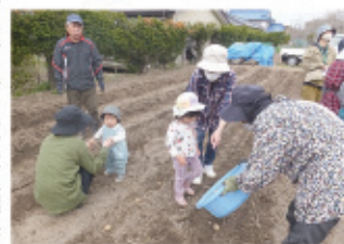
じゃがいも植付け交流会

デジタル化を推進し、事務処理の効率化や事務機器等の更新延長により経費を節減し、健全な財政運営に努めます。