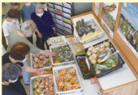
福祉会館玄関(会員の家庭菜園や村山農園で採れた野菜の販売)

今年、古希を迎えた私ですが、最近忘れっぽくなり編集後記の原稿も書くのを忘れていました。そろそろあの世から迎えが来るかも…… 来たら今はシルバーの仕事や行事が忙しいから暫く待ってくださいと言おうか…… 後、生きても二十数年ですが、せめて寝たきりにならないよう元気でやりたいことをやり、楽しく暮らして行きたいものです。 皆さん、シルバーの仕事や行事も意外と楽しいですよ、ご入会をお待ちしております。