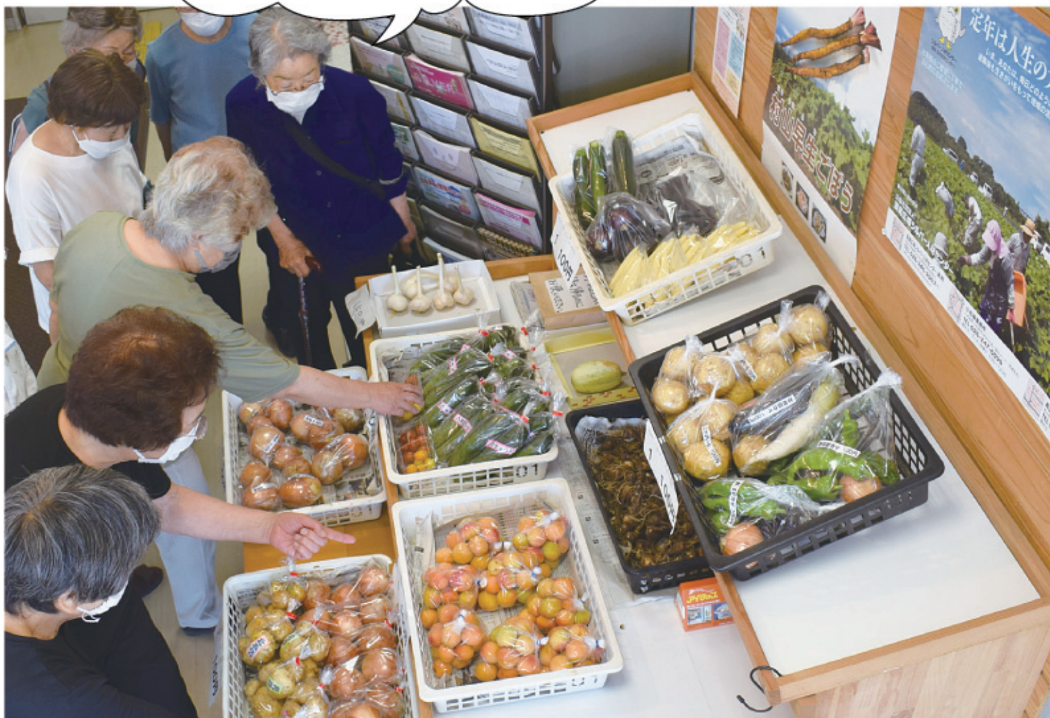
福社会館玄関(会員の家庭菜園などで採れた野菜の販売)

あら安い!!全部一袋100円! あんず、じゃがいも(北あかり・男爵・メイクイン)、 ズッキーニ、玉ねぎ、なす、八町きゅうり、ミニトマト、 ヤングコーン、野菜詰め合わせ・・・