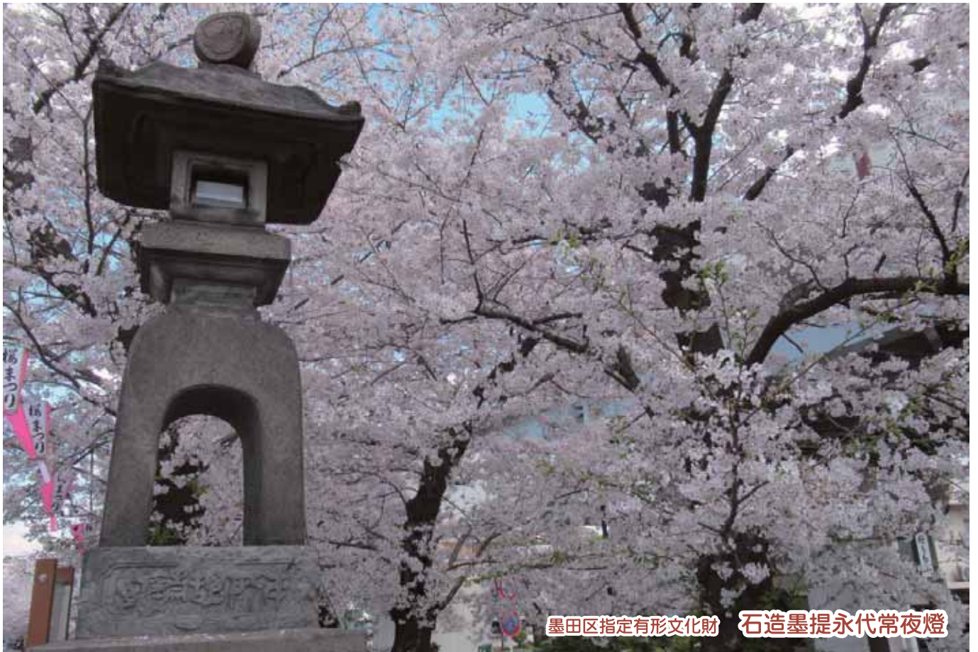
墨田区指定有形文化財 石造墨提永代常夜燈