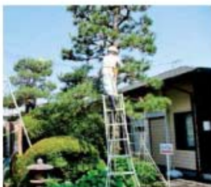
【中央公園：参加者32名】