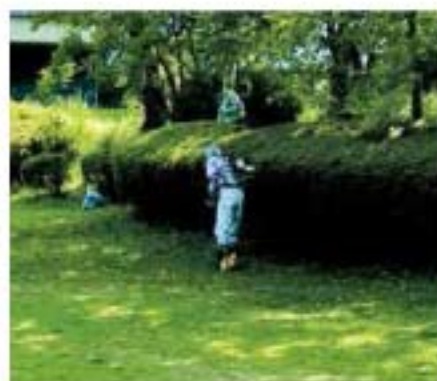
【小柄沢公園：参加者9名】