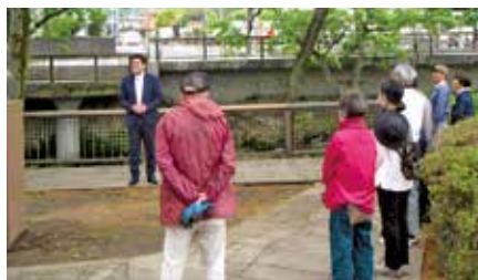
【小柄沢公園：参加者8名】