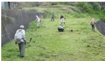
【中央公園：参加者39名】

中央公園・小柄沢公園・偕楽園を対象に71名が分散参加し、日頃の業務で培った技術を生かし、剪定や草刈りと草取りに汗を流しました。ご参加いただきました会員の皆様、お疲れさまでした。