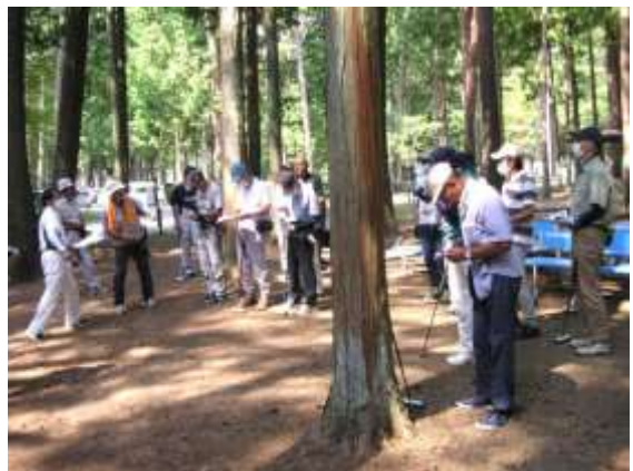
赤松・しらかばコースで実施