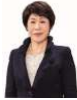
諏訪市長 金子ゆかり