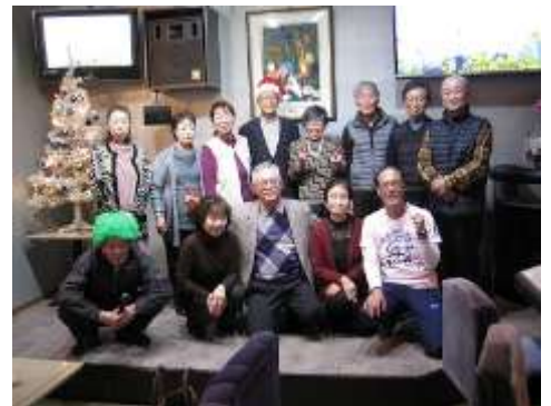
カラオケ同好会の皆さん ♪♪♪...