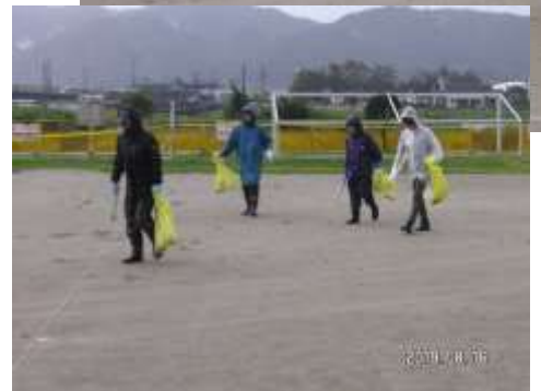
ヨットハーバーでの清掃活動