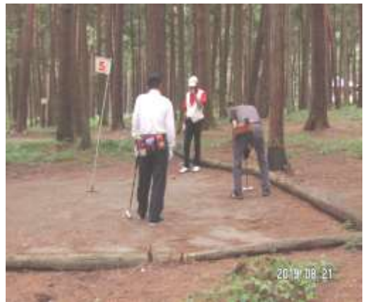
ひのき・赤松コースで実施