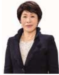
諏訪市長 金子ゆかり