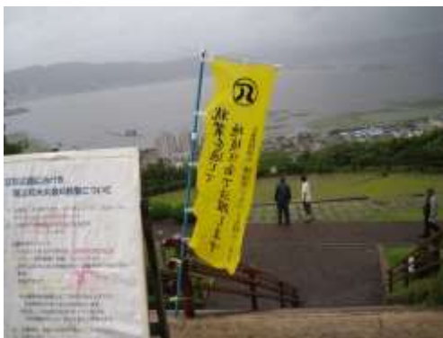
立石公園での清掃活動