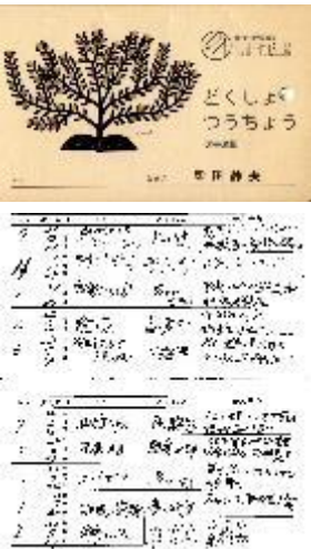
「読書通帳」に既読本の履歴を記録保存。