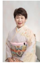
諏訪市長 金子ゆかり