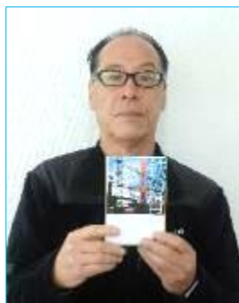
感銘を受けた「鉄の骨」を紹介して頂きました。

同じようなことを身近に見聞きしたり経験したりした人も多いのではないのでしょうか？私の近くにも残念ながら存在します。ですが、最後は必ず正義が勝ちます。そうあってほしいと強く望みます。シルバーの事務所に本を置いてありますので是非一読して感動を覚えて頂きたいと思っております。