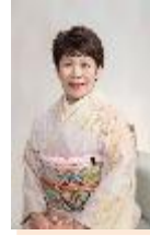
諏訪市長 金子ゆかり