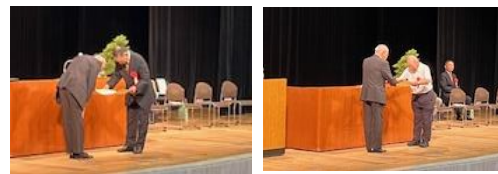
在籍・安全標語表彰

当日は、開会后、来賓の皆様からのご挨拶、会員表彰を行った後、議決権数報告、議長選任を行い、議案に入り、報告事項として「令和5年度事業報告」、決議事項として「令和5年度計算書類等の承認」が審議され、いずれも原案どおり承認可決され、閉会しました。