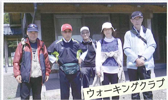
ウォーキングクラブ