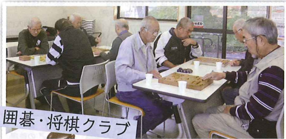
囲碁・将棋クラブ