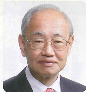
多賀城市長 菊地健次郎