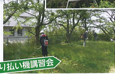
刈り払い機講習会