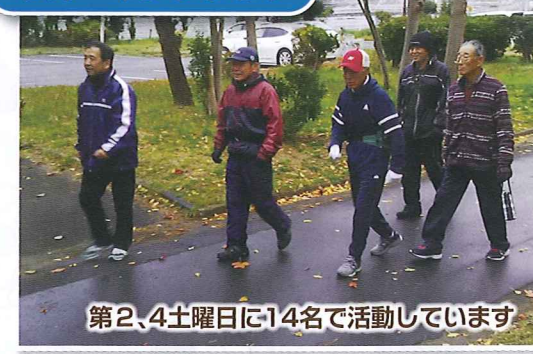
第2、4土曜日に14名で活動しています