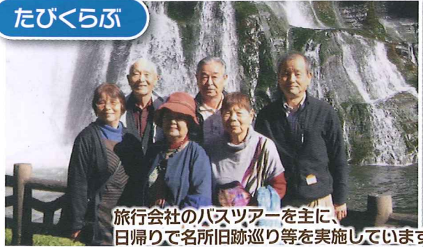
旅行会社のバスツアーを主に、日帰りで名所旧跡巡り等を実施しています