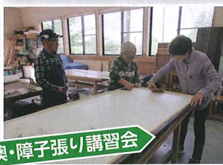
視・障子張り講習会