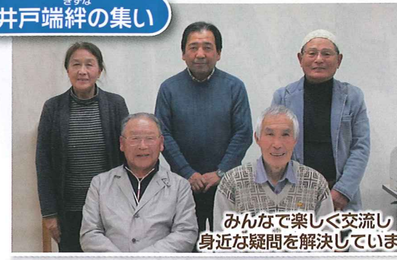
みんなで楽しく交流し身近な疑問を解決しています