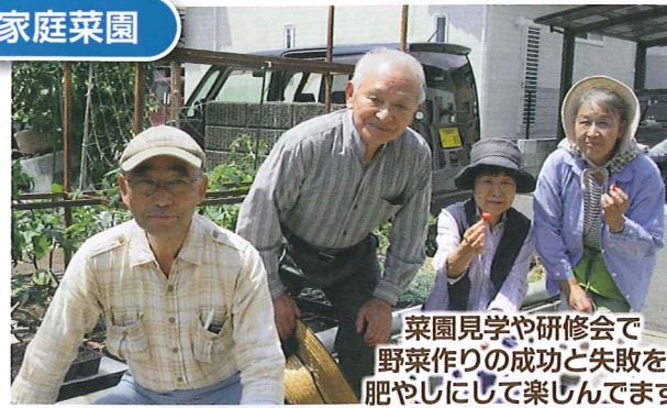
菜園見学や研修会で野菜作りの成功と失敗を肥やしにして楽しんでます