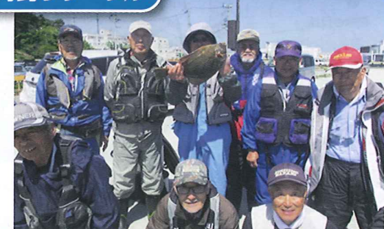
海釣り好きの方大歓迎!お待ちしております