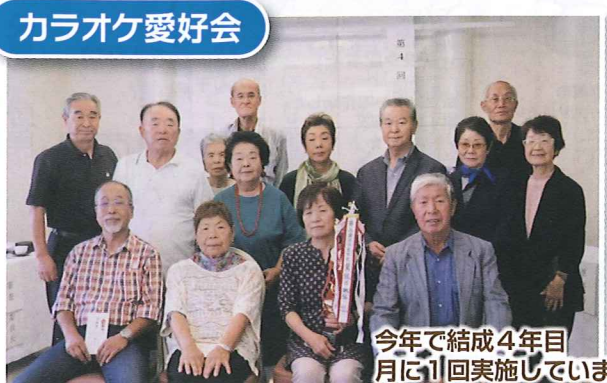
今年で結成4年目月に11回実施しています

各サークルの活動予定や最新情報は、シルバー事務局の専用ラックに常備しております。