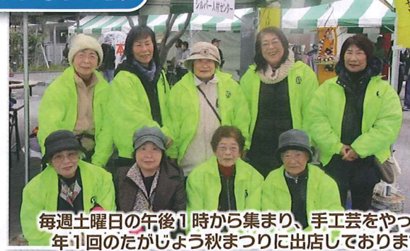
毎週土曜日の午後11時から集まり、手工芸をやって、年1回のたがじよう秋まつりに出店しております