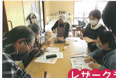
レサークラフト教室