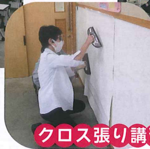
クロス張り講習会