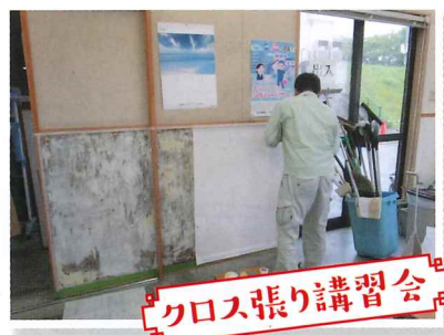
クロス張り講習会