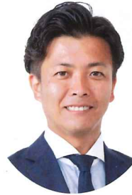
多賀城市長 深谷 晃 祐

令和六年の年頭に当たり、多賀城市議会を代表し、謹んで新年の御挨拶を申し上げます。会員の皆様方におかれましては、希望に満ちた新春をお迎え