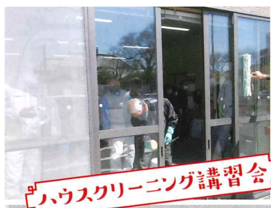
ハウスクリーニング講習会