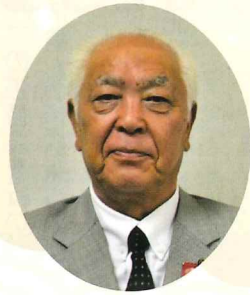
多賀城市議会議長