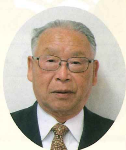
公益社団法人 多賀城市 シルバー人材センター 理事長