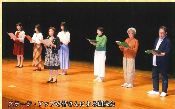
ステージ・アップの皆さんによる朗読会

今後とも、多賀城市シルバー人材センターは地域の皆様との共生を目指し活力ある長寿社会実現のために活動を進めて参りますので御協力をお願い致します。