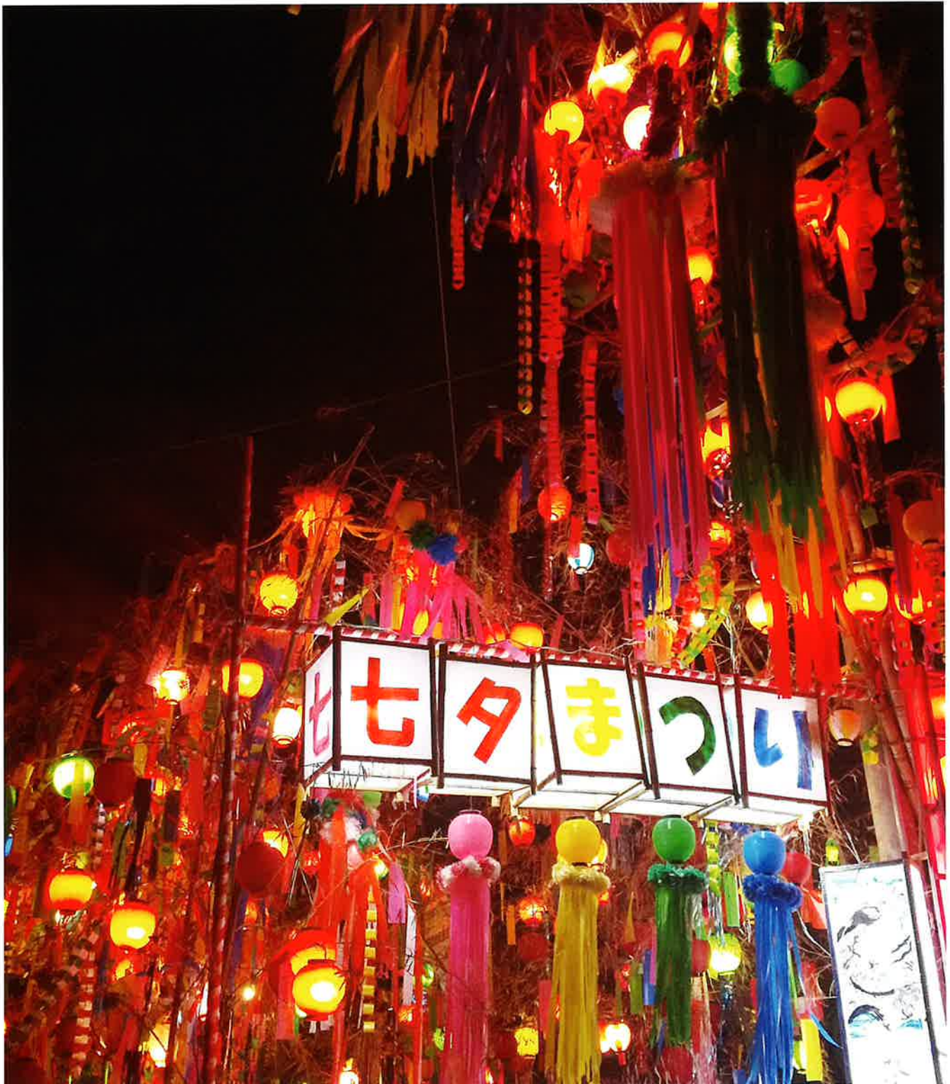
戸出七夕まつり ～世界平和を願って～ (7/3～7/7)

発行所 公益社団法人 高岡市シルバー人材センター 広報委員会 高岡市博労本町4番1号 TEL 20-1650(代) FAX 20-1648 E-mail:takaoka10@sjc.ne.jp 第43号 令和4年8月1日