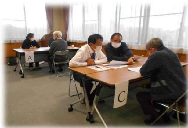
熱心に話を聞く参加会員