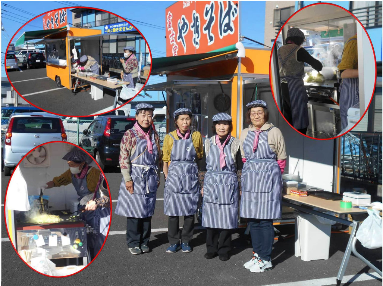
お揃いのユニホームでキッチンカーによる「富士宮やきそば」販売に励む女性会員の皆さん — 本部駐車場にて —

高崎市シルバー人材センターでは、令和4年度からセンターの独自事業としてキッチンカーによる「富士宮やきそば」の移動販売を計画していました。