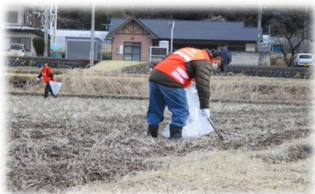
細かいゴミを拾う会員

3月4日(月)午前9時より倉渕地域の会員14名に参加していただき、ボランティア活動を実施しました。倉渕地域では昨年より、花火コンクールで田畑に落ちた花火のゴミを拾う作業を行っています。前日に行われた花火コンクールは全国から若手の花火師が集まって競い合う華やかなものですが、後には紙や導線などが田畑のいたるところに落ちてしまいます。倉渕支所よりゴミを拾うトングなどをお借りして1時間半ほど作業しました。普段顔を合わせる事のない会員同士が出会い、親睦を深めることのできる貴重な場でもあります。今回は、みんなでそろいのオレンジ色のベストを着て行き、センターの存在をアピールする良い機会になったかと思っています。参加していただいた会員の皆様、寒い中本当にありがとうございました。