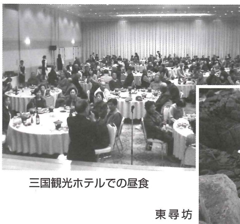
三国観光ホテルでの昼食