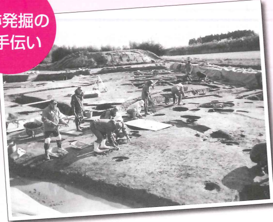
遺跡発掘のお手伝い