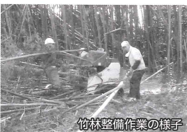
竹林整備作業の様子

1週間ほど過ぎると、作業の手順にも慣れたとはいえ、高さ10m程度の土堤の上に切り倒した竹を持ち上げる作業は大変な苦勞でした。それでも心配していた事故も無く、予定通り無事竹林整備作業を完了しました。地域の住民の皆さんから感謝のお礼の言葉を聞き、シルバー人材センターの役割は大変大きな物と実感しています。人生の達人の集団ともいえるシルバーの会員諸氏と共に大きな仕事をやり遂げたの思いは私だけではないと思えます。