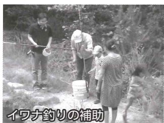
イワナ釣りの補助

定年退職後、田舎暮らしと海釣りに近い場所へ憧れ、2010年11月東京都から高島市の住人になり約1年半が経過しました。高島の生活にも慣れ、地域の方々と交流を増やし老人パワースタイルでも活用できる場所がないかと今年4月からシルバーの会員へ登録。現在は、高島市鹿ヶ瀬にある「近江あまごの里」へお客様が多い土日(隔週)に就業しています。就業内容は、お客様への釣り場説明、受付、精算、並びにお客様が釣り上げたあまご、ニジマス、イワナ等をご注文に応じ塩焼き、刺身、ホイール焼き等の料理