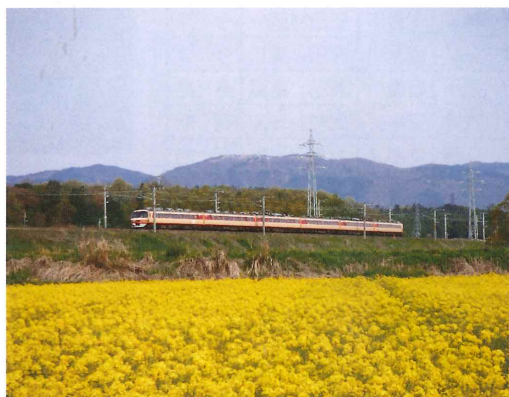
マキノ 石角 強さん 菜の花畑を行く湖西線の特急「雷鳥」。今は すべてサンダーバード号になって見る ことができない。2010年4月、新旭町で (後ろは箱館山)。