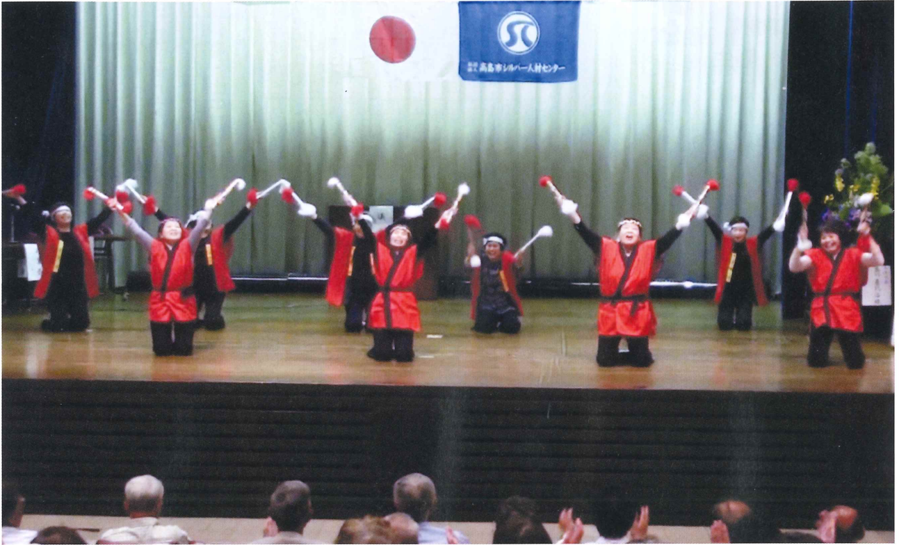
定時総会にて 女性部会による“銭太鼓”初披露

発行/公益社団法人高島市シルバー人材センター 広報部会 滋賀県高島市勝野215 TEL (0740)36-8191 FAX (0740)36-8010