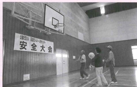
互助会では7月2日の安全大会(高島B&G海洋センター)の後、同センター体育館でふれあいデーを実施。ゴムボールを使ったバスケットボール大会を開き、楽しいひとときを過ごしました。

互助会では7月30日(火)午前9時から、今津総合運動公園「グランドゴルフ場」で、今年度1回目のグランドゴルフ大会を開きます。 上位入賞者、ホールインワンなどには賞品を用意しています。使用料は互助会で支払います(本人負担なし)。一人でも多くの参加をお待ちしています。 申し込みは7月19日までに、本部または連絡所までお願いします。秋には2回目の大会も行います。日程が決まり次第、お知らせします。