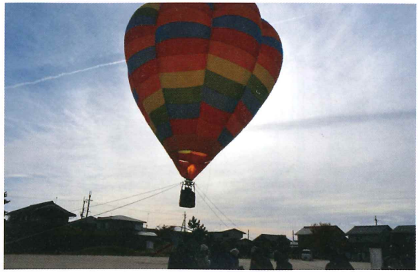
「わが町のイベントの日」