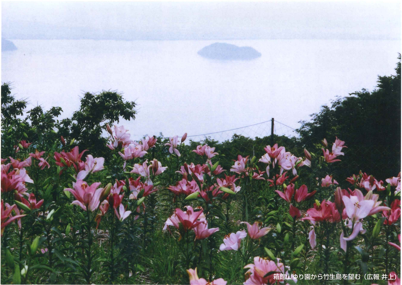
箱館山ゆり園から竹生島を望む

発行／公益社団法人高島市シルバー人材センター 広報部会 滋賀県高島市勝野215 TEL (0740)36-8191 FAX (0740)36-8010