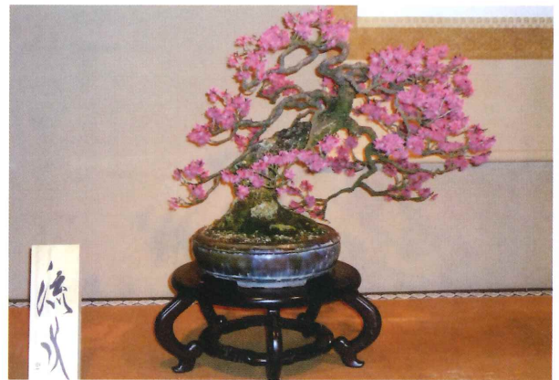
長浜盆梅展より 長谷川 政治 (安曇川)