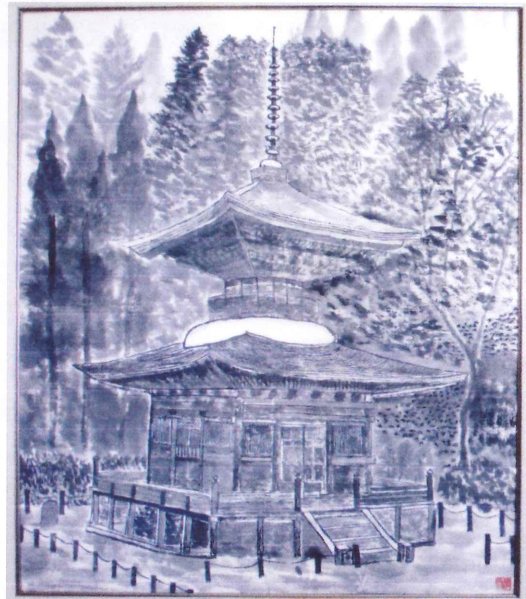
新旭 金矢 健一