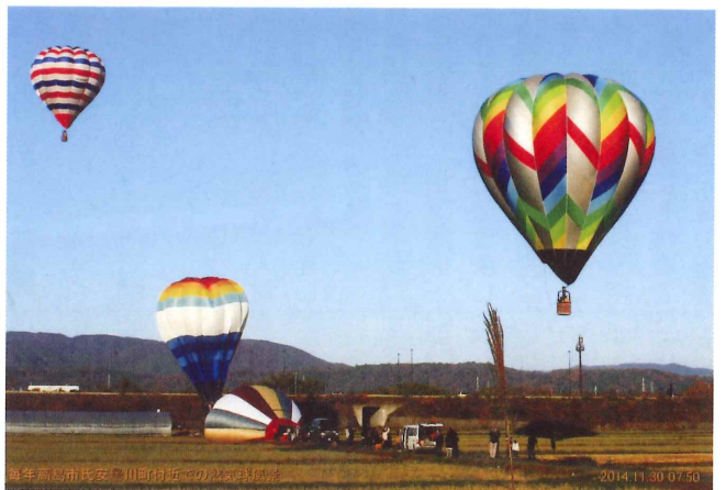
毎年行われる安曇川での熱気球風景 安曇川 長谷川 政治