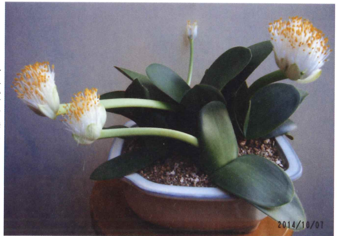
花は9月頃に咲いて、一カ月以上楽しめます。 (眉刷毛万年青) 今津 武友 幸一郎