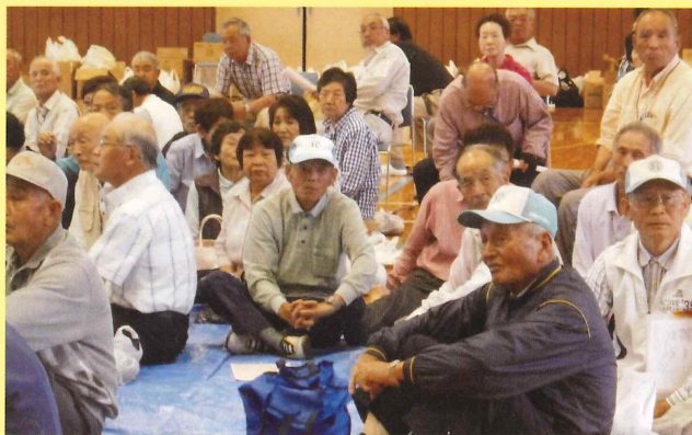
講演に耳を傾ける会員達