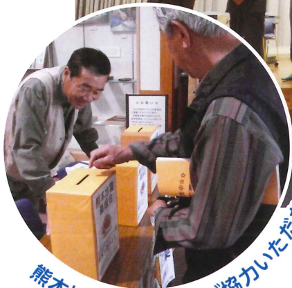
熊本地震の義援金にご協力いただきました