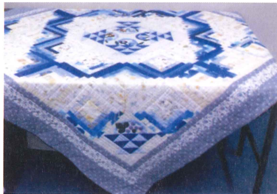
パッチワーク 朽木 森本 富子