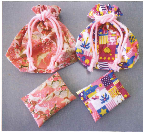
巾着袋とポケットティッシュケース 安曇川 岡本 良子