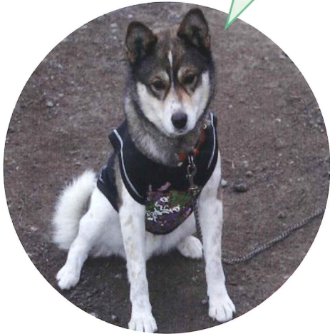
マキノ 川添 宏司さんの ミライくん やきもち焼きです