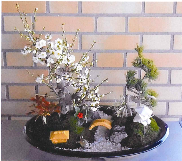
「松竹梅寄せ植え」 安曇川 早藤 隆生