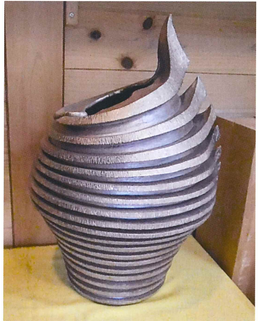
陶芸「輪廻」 市美術展覧会にて京都新聞賞を受賞されました