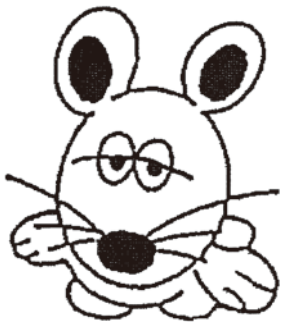
僕は小さな鳴きうさぎ (イラスト：初代)

人は大切な自然を破壊する力も、それを守る力も持っています。この地球上で水を必要としない生き物は存在しません。人は自分達が使う水は浄化しきれいにして使う能力を持っています。他の生き物たちは自然に任せるしかなく、自然環境破壊の犠牲者となっています。これから私たちが急いでしなければならぬことは沢山あります。しかし一番身近な簡単な方法は、一人一人が川を汚さない、汚させないこと、このささいな気配りだけで十分小さな生き物たち