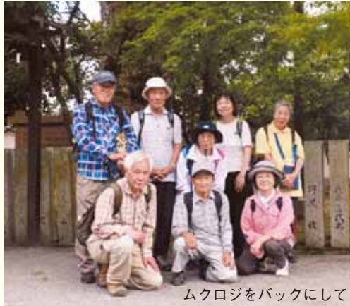
ムクロジをバックにして

梅雨曇りが続く7月初め、同好会のメンバー8人で、宝塚の名所・最明寺滝を觀賞し、源氏ゆかりの満願寺、多田神社を巡りました。阪急山本駅北出口から平井山荘方面への階段を上がる。巡礼街道の道標に従い、100m程直進し、貝尻広場で左折。高台にまで広がる平井山荘を見上げながら、住宅街を通り抜け溪谷沿いに進む。積み石で築かれた大聖不動尊の門を