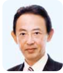
高槻市長 濱田 剛 史