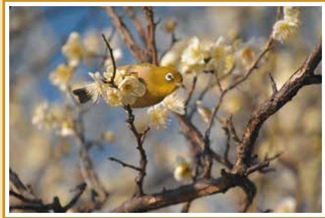
高槻4班 清水 明生