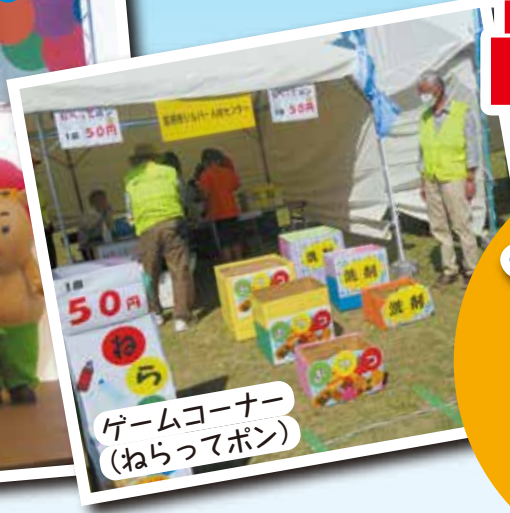
ゲームコーナー (ねらってポン)