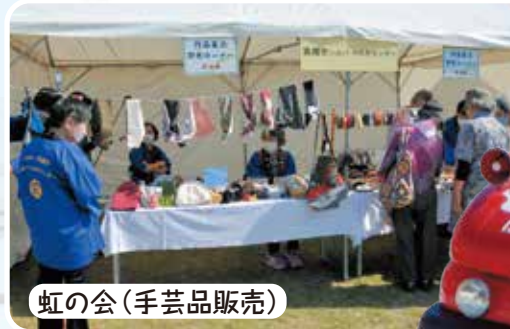
虹の会(手芸品販売)