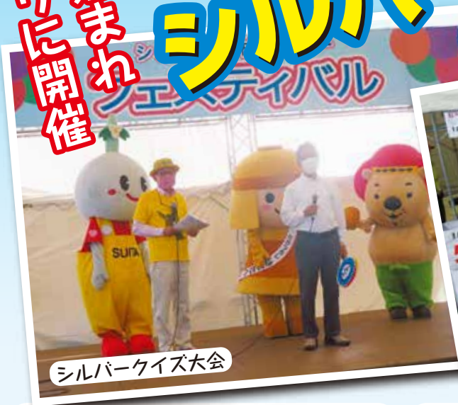
シルバークイズ大会