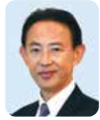
高槻市長 濱田 剛史