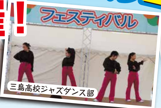
三島高校ジャズダンス部