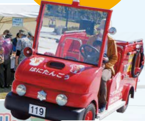
子ども達に大人気 『はにたんごう』