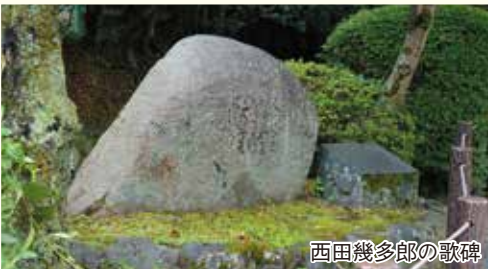
西田幾多郎の歌碑

JR京都駅前から銀閣寺方面行きの市バスに乗り銀閣寺道で下車。今出川通に出て道標に従い、最初に銀閣寺に向かう。銀閣寺橋を渡り、土産物店や飲食店が並ぶ参詣道を250mほど上ると、銀閣寺の入り口総門に着く。拝観は次回にして、銀閣寺橋まで戻り、哲学の道をスタートする。疎水に沿って青々としたソメイヨシノの並木道を進む。小川沿いには至る所で、アジサイが咲いている。法然院への分岐「洗心橋」を左手に見て少し行くと、哲学者西田幾多郎の歌碑がある。立ち止まって、しばらく歌碑に目をやる。一息入れ、敷石を一步ずつ踏みながら小径をたどる。流域には夏は蛍が飛翔する。趣がある風景が先々まですべて続いていく。安楽寺や真如堂との分岐を通り過ぎていくと、大豊神社御旅所が現れる。その先の橋を左に渡つ