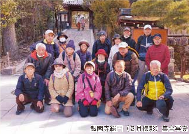
銀閣寺総門(2月撮影)集合写真

京都琵琶湖疎水分流に沿って、東山山麓に佇む銀閣寺から日本の道百選に選ばれている散策路「哲学の道」を経て、観光客で賑わう南禅寺・蹴上までじっくり歩きました。