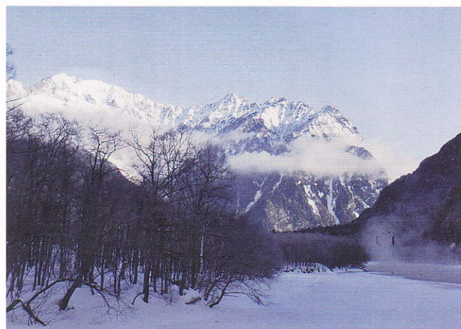
冬の上高地 和座 勝典