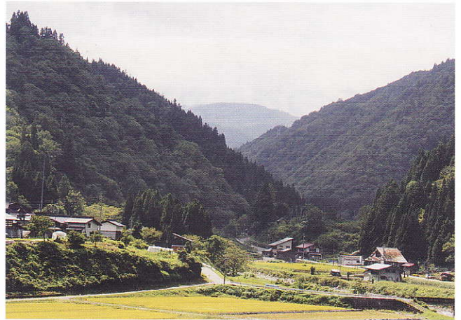
みのり 寺林 達男