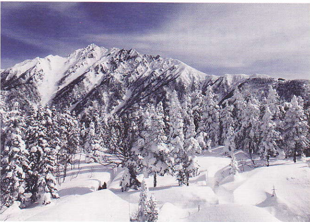
西穂高岳遠望 内木 真一