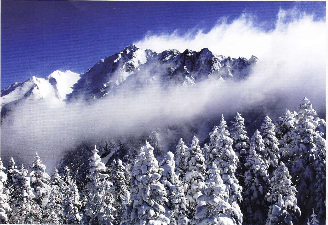
「厳冬の西穂高連峰」