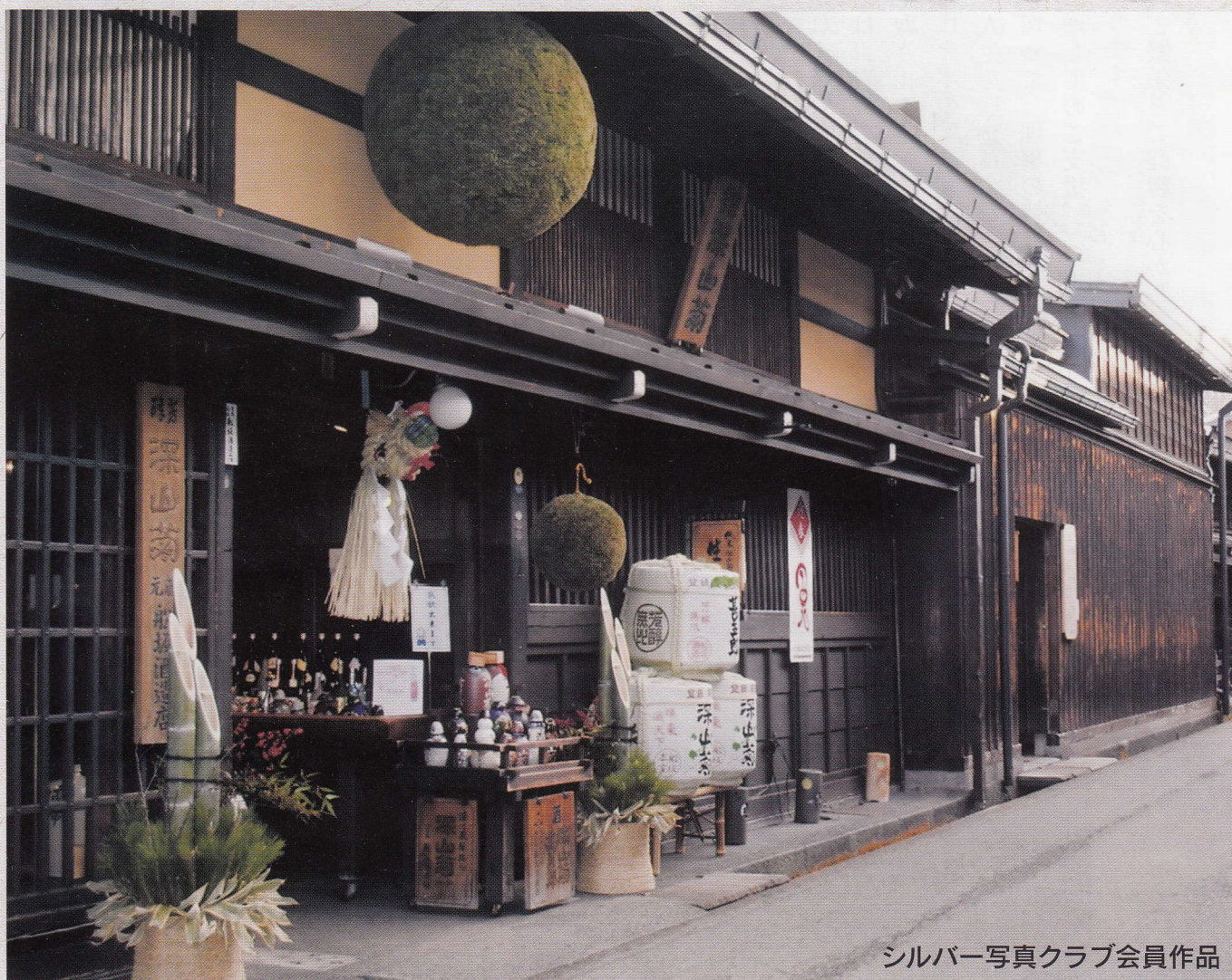
シルバー写真クラブ会員作品