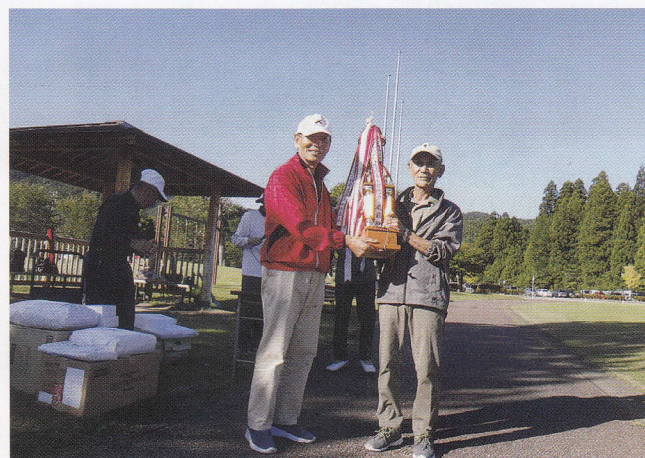
秋のグラウンドゴルフ大会