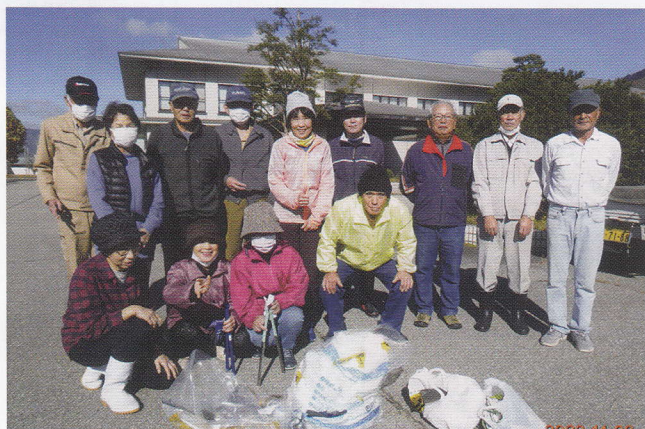
上宝シルバーがんばろう会 ゴミ拾いボランティア