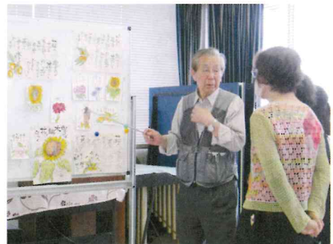
絵手紙教室の様子