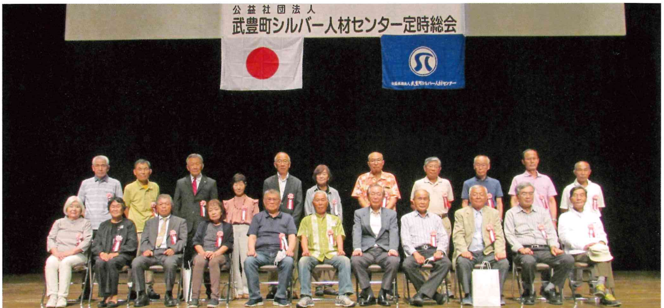
定時総会で10年及び5年連続就業の表彰を受けた会員