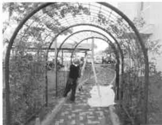
つるバラのアーチの塗装作業