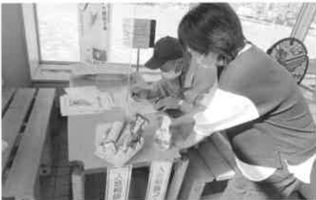
入会相談コーナー 入会していただきました！

来場者からは、「シルバーの働き方など詳しい話しが聞けて良かった。会員の平均年齢が74歳という事に驚いた、自分もまだまだ働けますね。」といった声を聞くことができました。