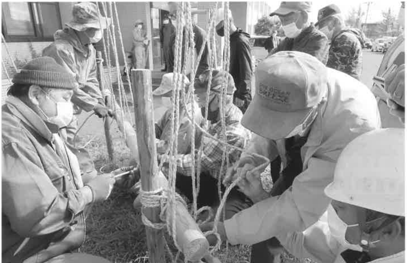
10月13日に31名の会員が参加し、森上講師による座学講習の後、シルバーの前庭で実技指導が行われ、先輩会員の熟練の技を皆さん真剣に習っていました。