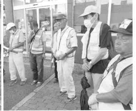
滝川祭りパトロール