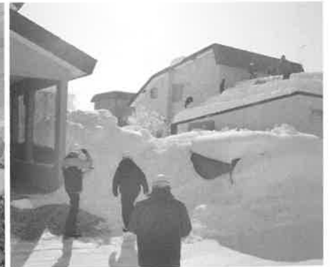
冬の安全パトロール