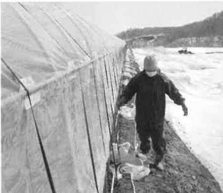
ハウスビニール張り