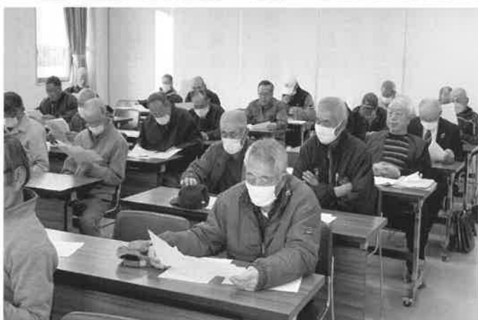
● 冬囲い講習会(右上・左上) ● タイヤ交換講習会(左下) ● 除雪講習会(右下)