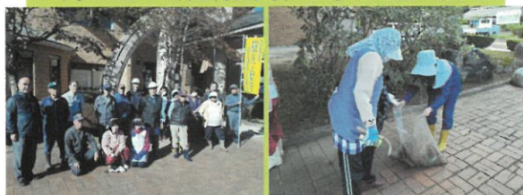
10月24日 都路行政局、みらい公園（除草）