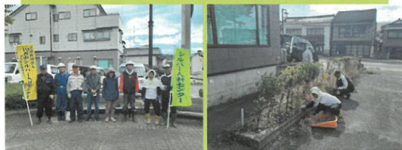
10月27日 中町ふれあい公園（除草・剪定）