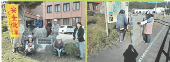
10月25日 滝根行政局（除草）