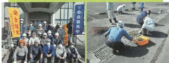
10月23日 大越行政局（除草）