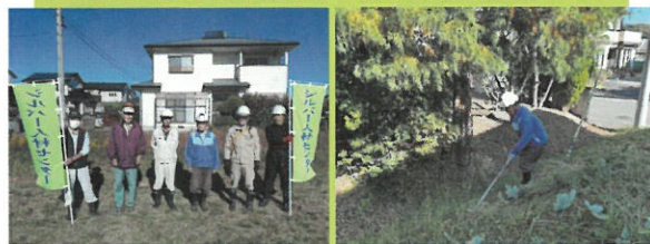
10月23日 東部台地内市有地（除草）