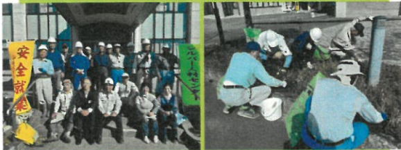
10月15日 大越行政局 (除草作業)