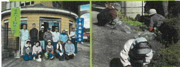
10月24日 都路行政局、みらい公園 (除草作業)