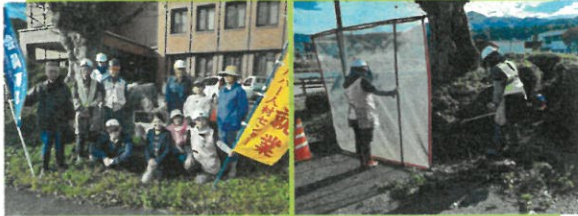
10月29日 滝根行政局 (除草作業)