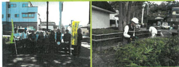
10月19日 中町ふれあい公園 (除草・剪定)