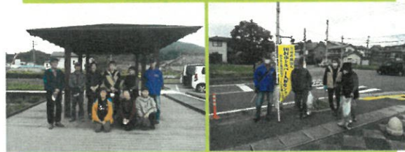
10月26日 学園通り、見晴らし通り、平和通り (ごみ拾い)