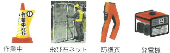
作業中カラーコーン

シルバー人材センターでは、会員がセンターから委託された請負の仕事で使用する場合にのみ、右記物品を貸出しています。なお貸出品は長期間使用することなく、使用後は速やかに返却してください。