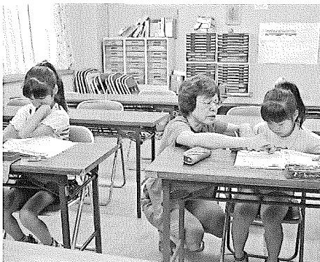
◀指導風景(大街道教室)