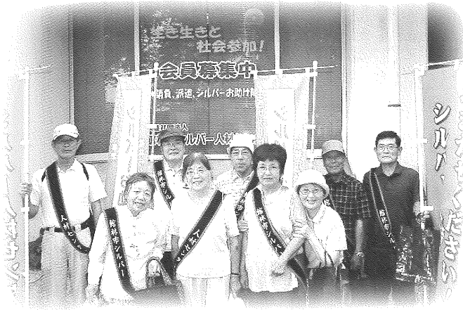
▲ 館林まつり参加 (新事務所前)