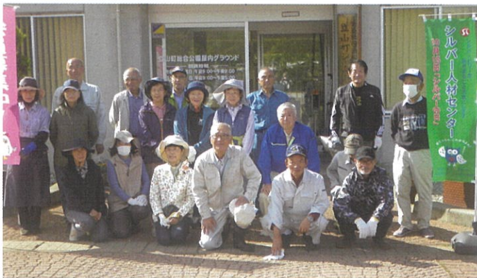
午前の部の参加者

今年も昨年同様に午前・午後の2回に分けて開催し、社会奉仕活動終了後に会員研修も併せて実施しました。当日は、立山町総合公園内及び周辺の落葉集めや草刈りを行った後、午前中は、ドローン講習と刈払機の講習を、午後からは、雪吊・雪囲い縄縛り講習と消しゴムはんこ講習を行いました。