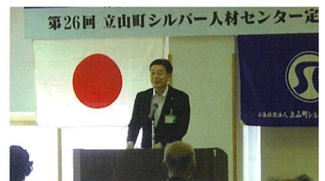
立山町長 舟橋貴之様よりご祝辞