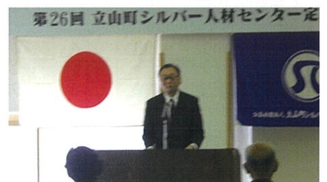
シルバー連合会会長ご祝辞