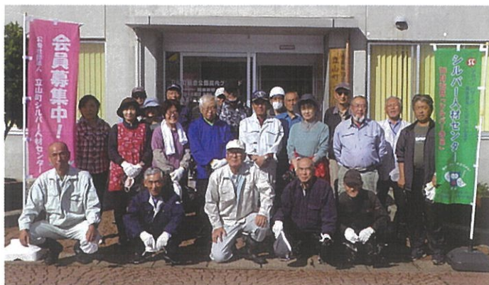
午後の部の参加者