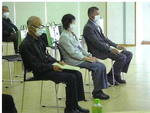
優良会員表彰の皆さん