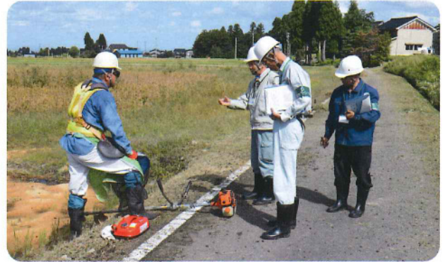
「安全作業に気をつけて」安全パトロール 10月4日