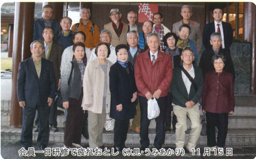
会員一日研修で疲れおとし(氷見・うみあかり) 11月15日