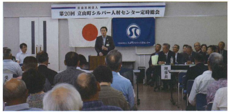
第20回定時総会(町民会館) 5月30日