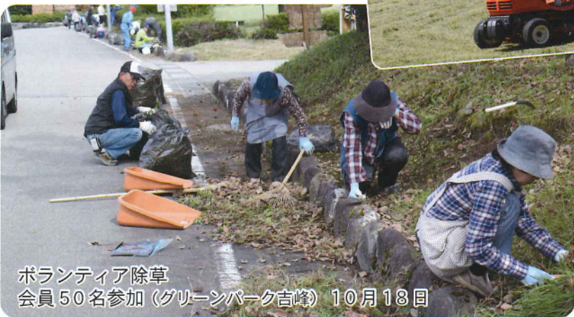
ボランティア除草 会員50名参加(グリーンパーク吉峰) 10月18日