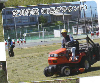
芝刈作業(町民グラウンド)