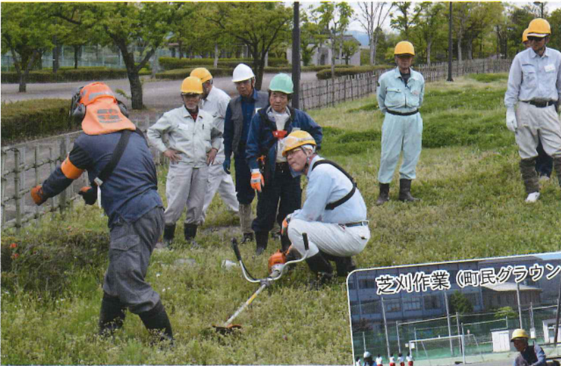
刈払い機講習会 4月28日