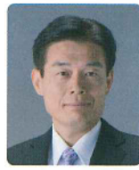
立山町長 舟橋 貴之