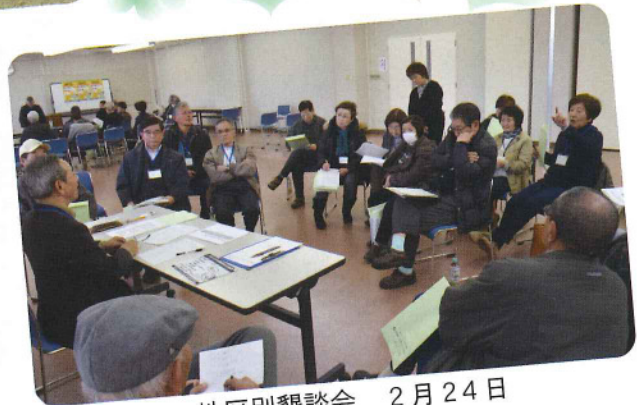
地区別懇談会 2月24日