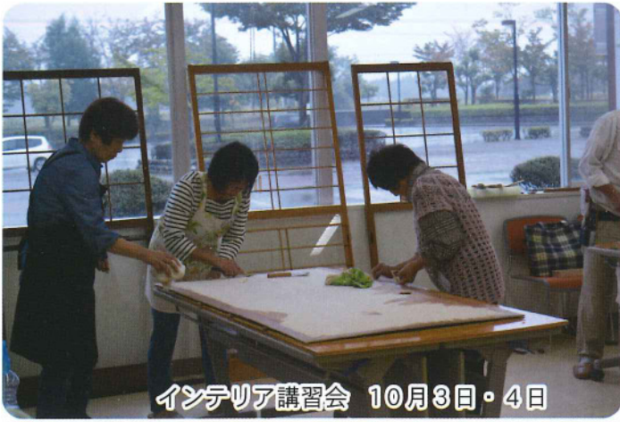
インテリア講習会 10月3日・4日