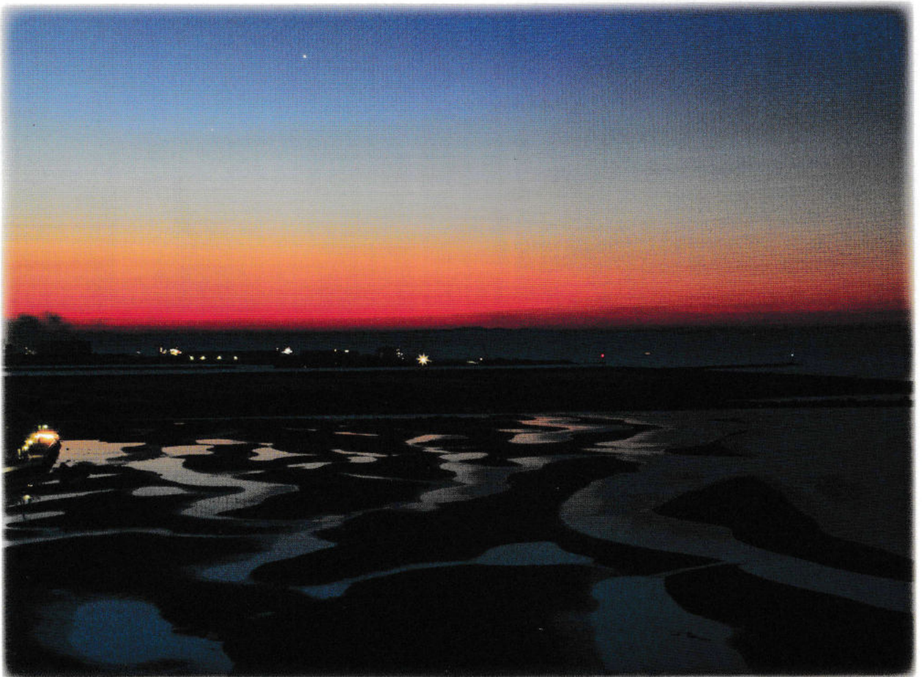
夜明けの干潟