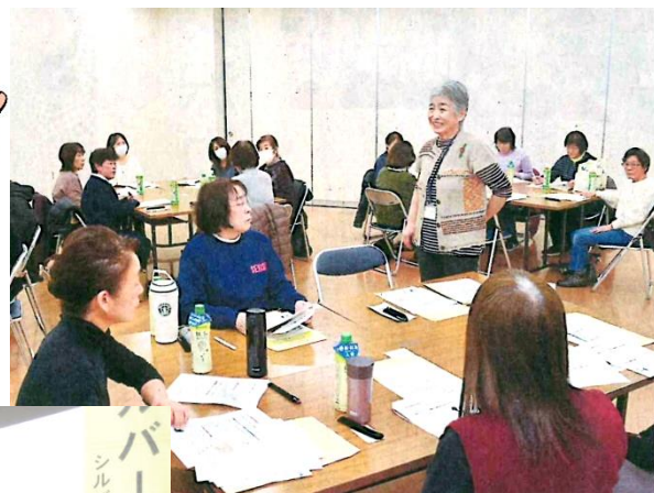
女性限定入会セミナー