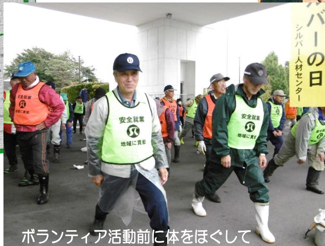
ボランティア活動前に体をほぐして