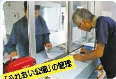
「ふれあい公園」の管理