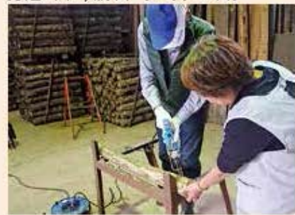
原木しいたけ栽培講習 (11月20日)