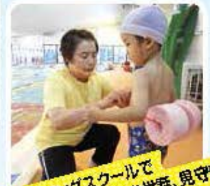
スイミングスクールで児童のお世話、見守り