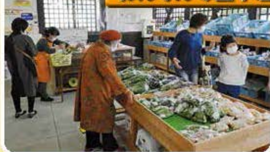
会員の丹精込めた新鮮野菜を揃えています