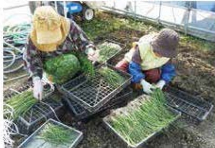
「花の里クラブ」(収穫と植付け体験)