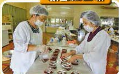
昔ながらの味 自慢の梅干し詰め作業