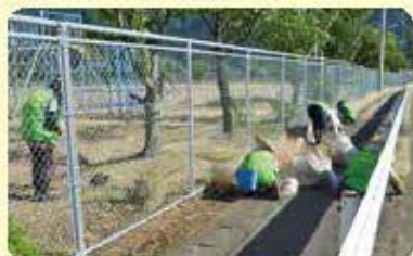
乾側地区地域班 (6月10日)