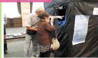
反射材の効果を体験