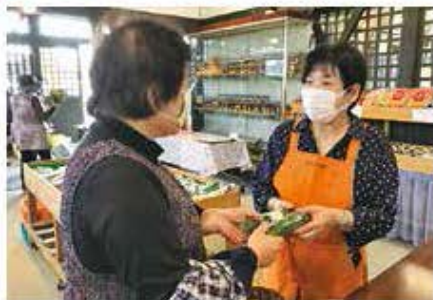
「ねんりんの里本店」(接客体験)