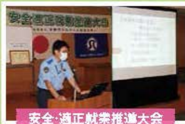
安全・適正就業推進大会