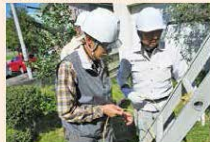
剪定雪吊り講習 (10月15日)