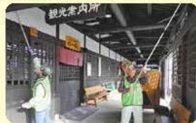
大野8-10地区地域班 (11月1日)