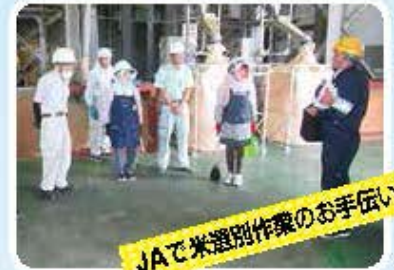
JAで米選別作業のお手伝い