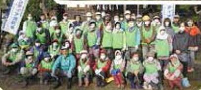
柳瀬社清掃 (10月24日) (福利厚生部会)