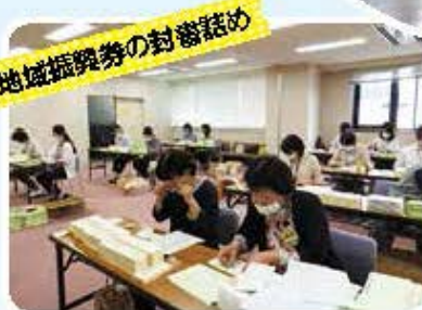
地域振興券の封筒詰め