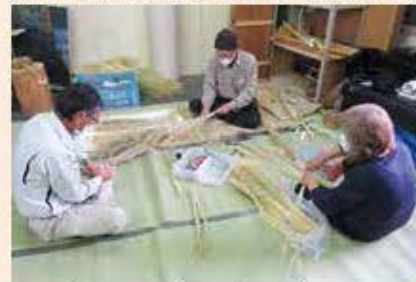
わら細工講習 (11月26日)