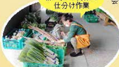
朝7時から野菜の仕分け作業