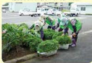
上庄地区地域班 (7月24日)