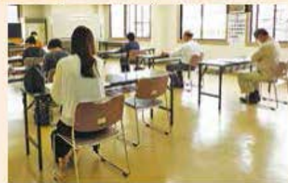
観光案内講習 (9月30日)