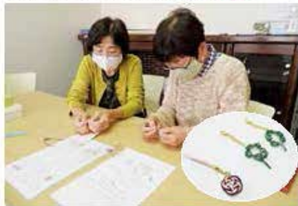
「の一そん工房」(水引細工の体験)