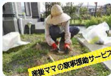
産後ママの家事援助サービス