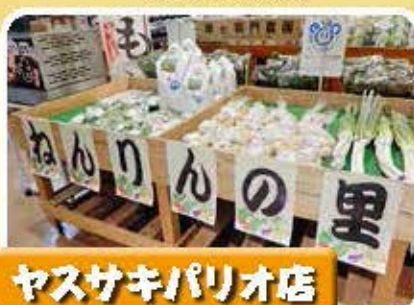
ヤスサキパリオ店