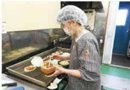
「ばあばの工房」(ねぎ焼き作り体験)