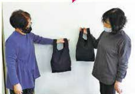
「ねんりん工房」(縫製体験)